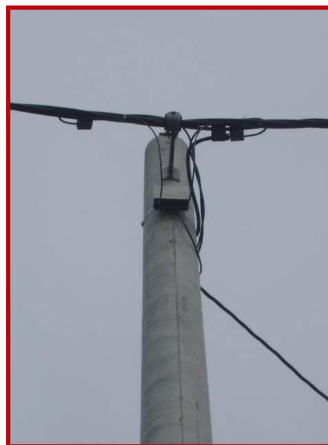
Slika 4. Primjer montaže kabela

Posebna pogodnost je da se prilikom montaže koristi postojeći ovjesni pribor. Nakon završenih testiranja kabeli s brojljima za daljinsko očitavanje instalirani su u blizini Siska u srpnju 2007. godine (slika 4.). U više od pola godine eksploatacije nije bilo nikakvih problema u radu.