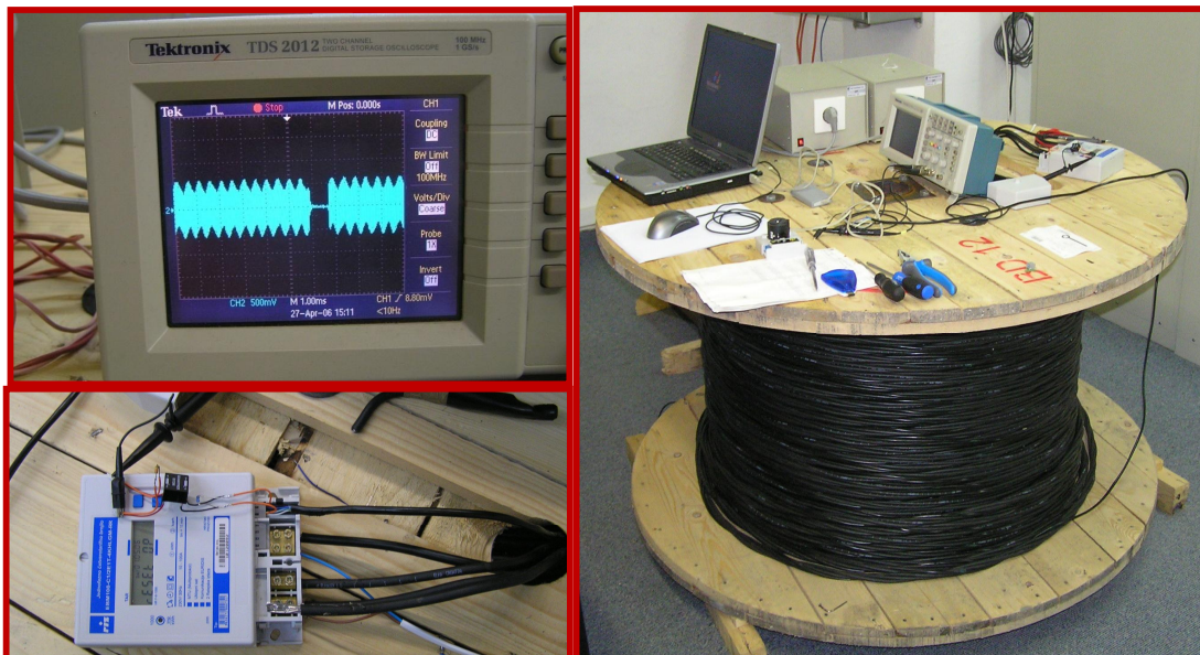
Slika 2. Ispitna oprema s testiranim kabelom

Kod ovih ekstremnih uvjeta pogrešna očitavanja radi induciranih napona pojavljuju se samo u 1-2% slučajeva. Uzimajući u obzir da su ovi testni uvjeti višestruko teži od uvjeta kojima će brojila i kabel biti izloženi u stvarnom radu, ispitivanjima je dokazano da kabel i brojila pravilno funkcioniraju.