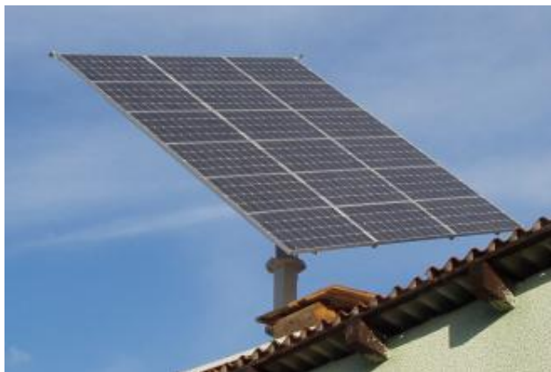
Slika 2. Mikrosunčana elektrana Vincetić – moduli na okretnoj konzoli

Sustav mikrosunčane elektrane Vincetić čini 98 aktivnih fotonaponskih modula smještenih na krovu kuće, gospodarskog objekta i garaže. Kao što je spomenuto 18 modula je smješteno na konzoli okretne konstrukcije. Za DC/AC pretvorbu električne struje ugrađena su tri pretvarača – izmjenjivača (eng. Invertera) snage 2 x 2500 W + 1 x 1300 W. Pretvarači su od renomiranog proizvođača i u sebi objedinjuju sve sklopove potrebne za siguran i pouzdan rad na niskonaponskoj mreži u paralelnom