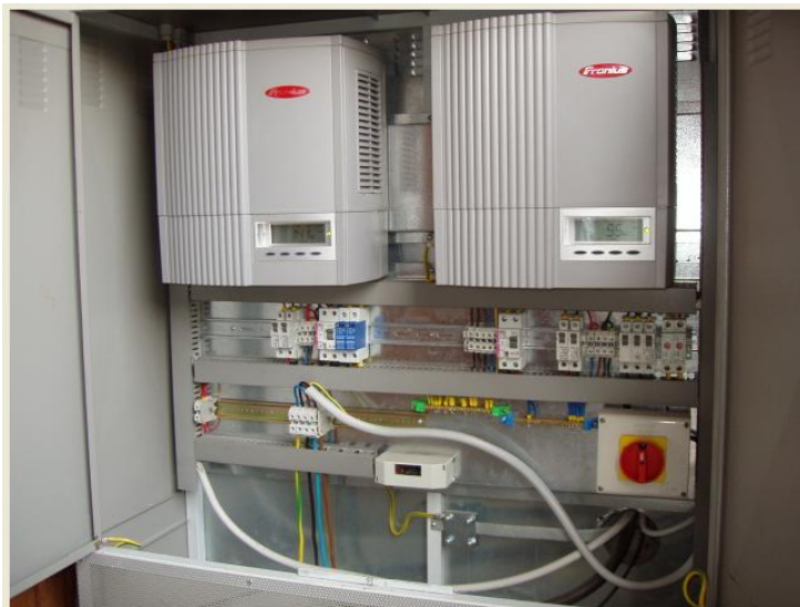
Slika 3 Mikrosunčana elektrana Vincetić – Pretvaračko izmjenjivačke jedinice

Važan je podatak i specifični trošak odnosno cijena 1 kW instalirane snage elektrane koja u slučaju Elektrane Vincetić iznosi 57.300 kn/kW odnosno 7.850 €/kW.